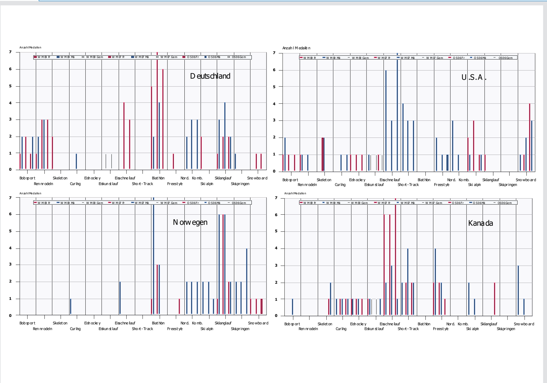
ABB. 6 Mehrjähriger Vergleich erfolgreicher Wintersportnationen

Entwicklung und Verteilung der Medailleenerfolge der Wintersportnationen Deutschland, USA, Norwegen und Kanada im mehrjährigen Vergleich der Olympische Spiele Turin 2006, WM 2007, WM 2009 – differenziert nach Frauen- (rot), Männer- (blau) und gemischten Wettbewerben (weiß)